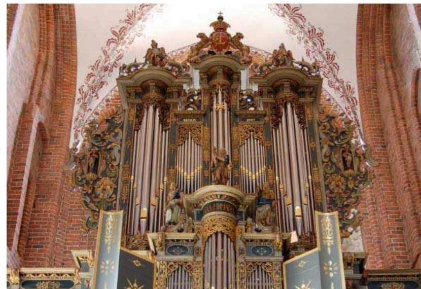
Marienkirche di Helsingør dove Dietrich Buxtehude è stato organista dal 1660 al 1668

Preludi, Fughe, Canzonette e Corali vari Dietrich Buxtehude 1637 - 1707